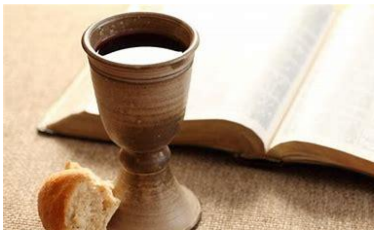
Nattverds måltid- Vin og brød